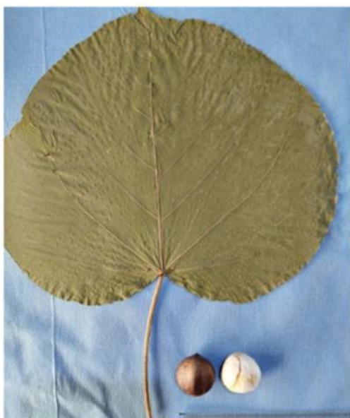
Figura 2. Hoja y semilla de Aleurites sp.

Para dilucidar el diagnóstico, lo primordial es realizar una historia clínica bien detallada al paciente o en caso de menores de edad a sus representantes legales para así poder identificar el tipo y las características de la sustancia tóxica, el tiempo que ha pasado desde el evento y los síntomas que se han presentado hasta la llegada del paciente al hospital así como el tratamiento administrado en casa; se debe realizar una exploración física minuciosa enfocada en los signos vitales, problemas respiratorios y neurológicos.