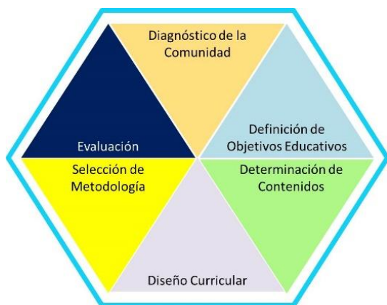
Figura 1. Fases de la Planificación Curricular