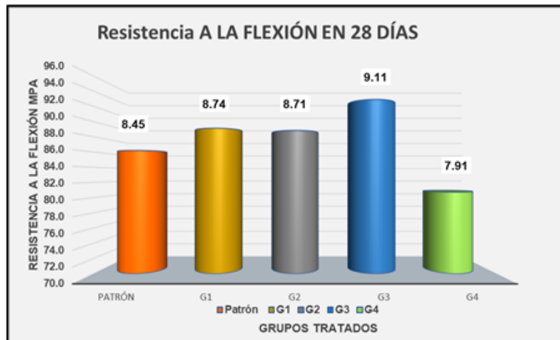
Figura 2. Grafica de Resumen de Resistencia a la Flexión.