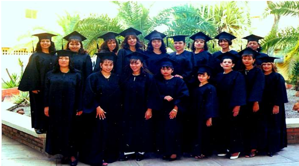
Figura 8. Segunda promoción de TSU en Enfermería, UCLA. La mayoría de ellos también serían de la II promoción de licenciadas.