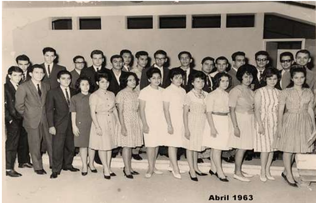
Figura 2. Estudiantes de Medicina, fundadores, recibiendo clases en la planta baja de lo que es hoy en día el Rectorado de la UCLA.