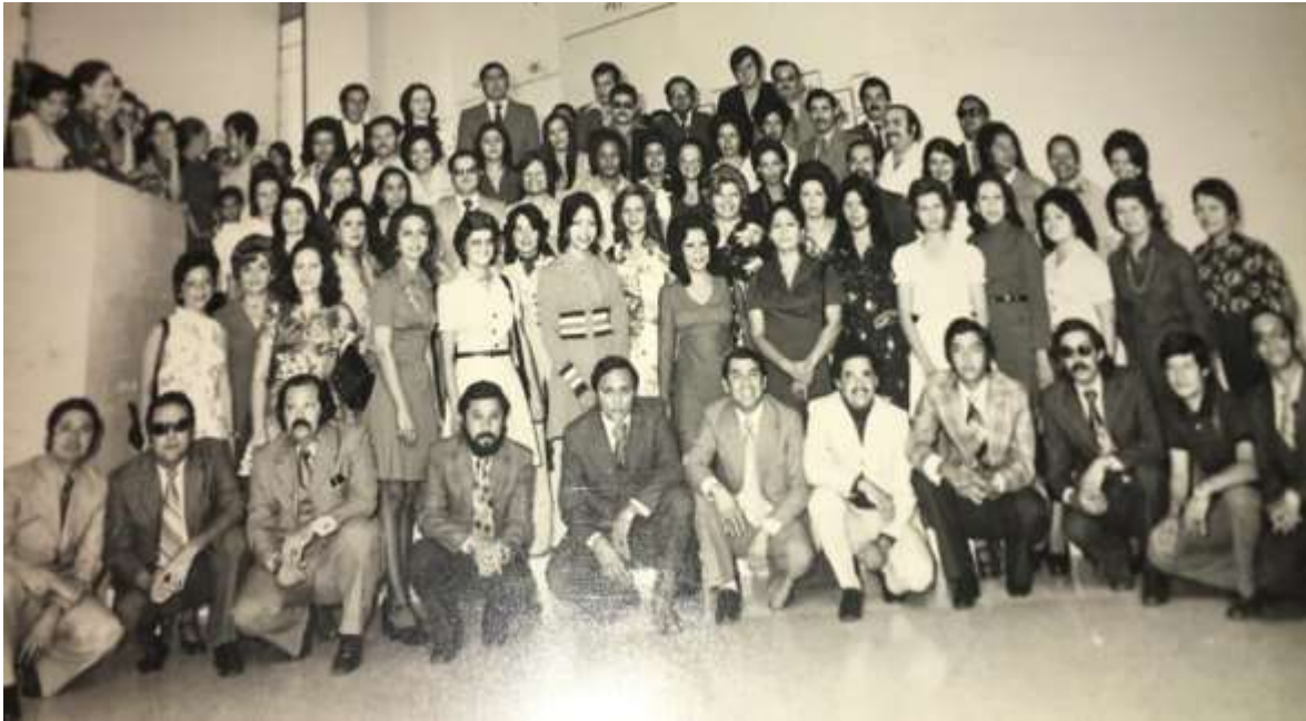
Figura 1. Foto primera promoción de Administradores Públicos