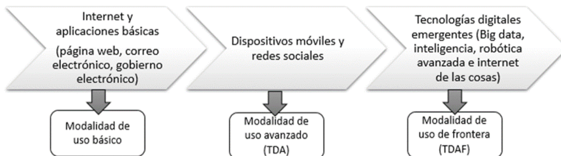
Figura 1. Fases y usos de la transformación digital en cuanto a la evolución de las TIC.