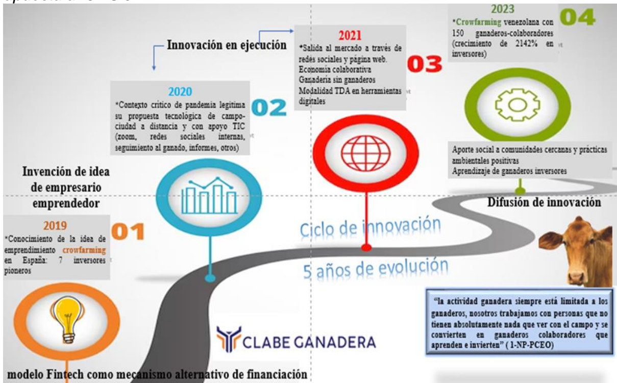
Figura 4. Clabe Ganadera y su aporte al crecimiento de la industria: evolución y apuesta al ODS 9

Se recomienda que los casos de éxito sean estudiados, en enfoque cualitativo, dando voz a la gente que hace realidad la experiencia del campo de estudio. Es determinístico pensar que el sector ganadero no puede tener experiencias de éxito solo porque los datos cuantitativos de investigaciones como las de la CEPAL (2022) así lo muestran. Es preciso dejar hablar a la gente que hace ganadería innovadora para poder escuchar: “conozcan un poco más y se darán cuenta de que en Venezuela hay gente chévere y responsable que está haciendo las cosas bien” (5: 1960-1991, entrevista 2, 2023 julio).