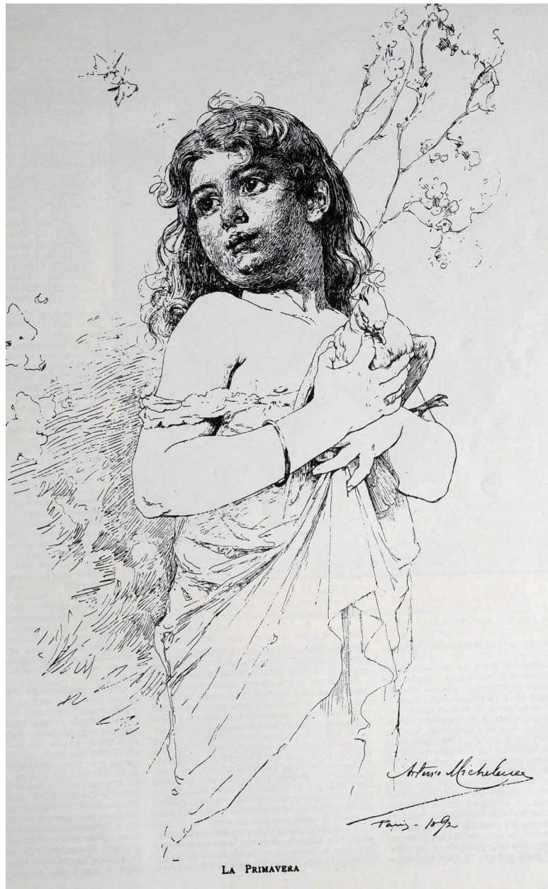
La primavera , Arturo Michelena, El Cojo Ilustrado , 1° de mayo de 1892, Nro. 9.

“Es de Arturo Michelena el precioso dibujo, quien desde París nos envía tan estimable obsequio. Nuestra gratitud por el regalo y nuestros votos porque el aplaudido compatriota siga recogiendo los laudos á que es acreedor por sus talentos, en país como Francia donde se le reconocen sus altos méritos y se premian debidamente sus esfuerzos”.