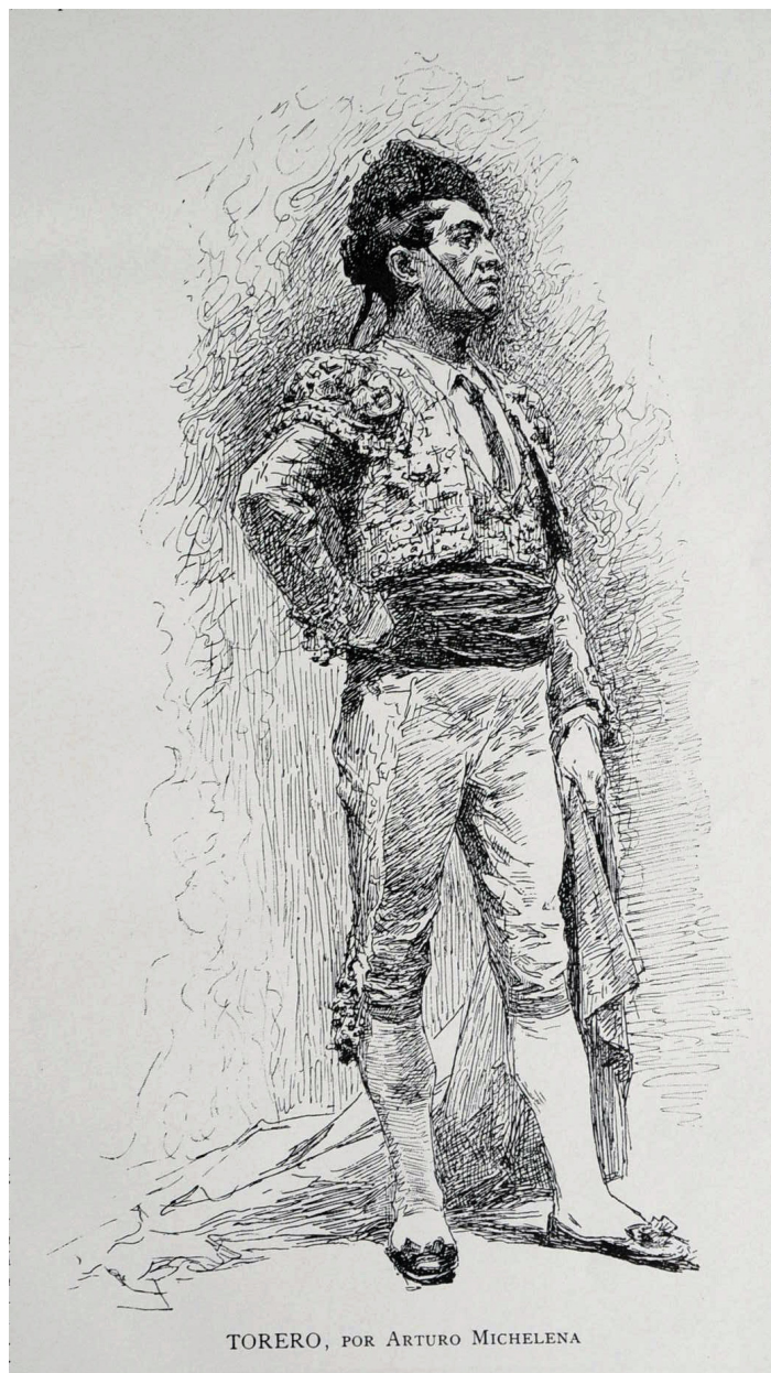
Torero , Arturo Michelena, El Cojo Ilustrado , 1° de enero de 1892, Nro. 1.

“El original de este grabado es un estudio á la pluma de nuestro ya célebre compatriota quien lo envió como obsequio al señor Tomás Michelena. Nos complacemos en reproducirlo”.