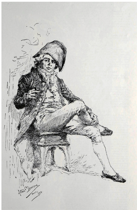
El fumador , Arturo Michelena. El Cojo Ilustrado , 15 de mayo de 1892, Nro. 10.

“Este bello estudio del natural de nuestro Arturo Michelena, pinta con exactitud los efectos fisio psicológicos de la borrachera, vicio antiquísimo, enaltecido en la Mitología y literatura griega y romana, y practicado con entereza y precisión prosáica por nuestros hermanos del siglo XIX. ¡ Por más que la ciencia lo repudie, y haya Tolstois y D’amices en el mundo, siempre triunfará victorioso el aguardiente!”.