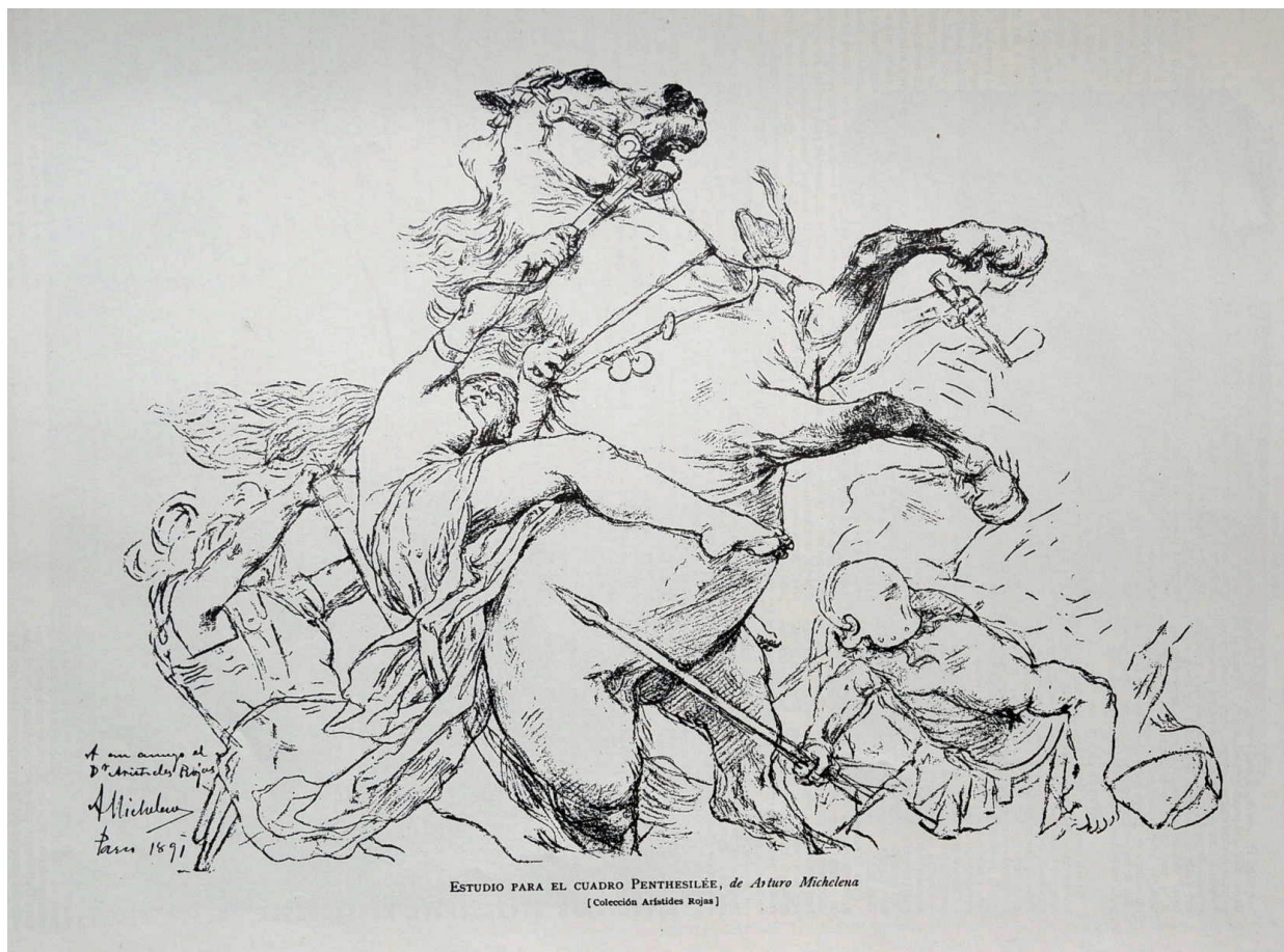
Estudio para el cuadro Penthesilée (colección de Aristides Rojas). El Cojo Ilustrado, 1 de septiembre de 1892, Nro. 17.

La revista dijo de este “estudio” lo siguiente: