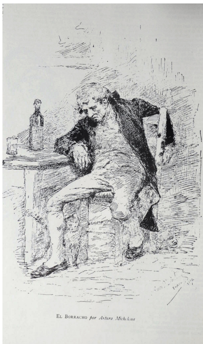
El borracho , Arturo Michelena. El Cojo Ilustrado , 15 de mayo de 1892, Nro. 10.

“Este bello estudio del natural de nuestro Arturo Michelena, pinta con exactitud los efectos fisio psicológicos de la borrachera, vicio antiquísimo, enaltecido en la Mitología y literatura griega y romana, y practicado con entereza y precisión prosáica por nuestros hermanos del siglo XIX. ¡ Por más que la ciencia lo repudie, y haya Tolstois y D’amices en el mundo, siempre triunfará victorioso el aguardiente!”.