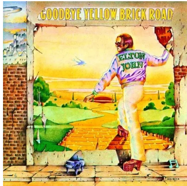
Portada del álbum Goodbye Yellow Brick Road de Elton John, publicado en el año 1973 (3)

Es interesante pretender un paralelismo entre estos dos poemas épicos y míticos, sucedidos en contextos históricos distintos y con una inmensa carga simbólica. El Bhagavad-gita , es una escritura con inspiración en la India milenaria que recoge la conversación entre Krishna y Arjuna en el campo de batalla, mientras que la Odisea es la narración de Odiseo sobre su peregrinar y aventuras después de la Guerra de Troya y su retorno a Ítaca.