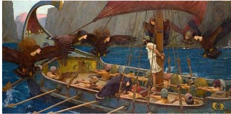
Ulises y las sirenas , cuadro del pintor John William Waterhouse, realizado en 1891. National Gallery of Victoria de Melbourne, Australia.

En el prólogo que a la traducción de la Odisea escribe Carlos García Gual, se formula una pregunta cuya respuesta nos da a manera de paradoja, situando los relatos y las historias contadas por Odiseo en el ámbito de lo maravilloso: “Por lo tanto, bien podría plantearse el lector de la Odisea una inquietante cuestión: ¿cuándo cuenta la verdad y cuándo miente Odiseo?, a la que cabe una solución fácil: cuando relata hechos tremendos, fabulosos, increíbles, Odiseo está diciendo la verdad. Cuando refiere sucesos verosímiles, como rapto de niños por piratas fenicios, por ejemplo, está fabricando una mentira”. (Homero, 2016, p. 21). Un recurso que dirá es propio de la escritura posterior a manera de retórica. (4)(5)