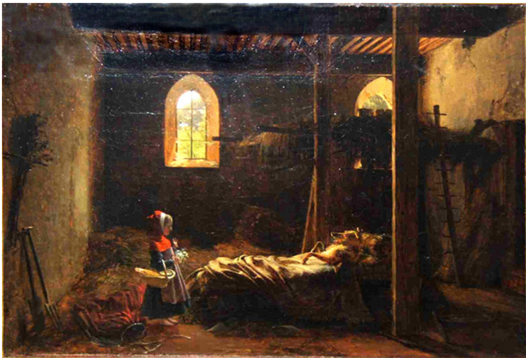
La caperucita roja , obra de Fleury-Richard de la Escuela de Lyon, c. 1820. Museo del Louvre

Es, también, la carta de La Luna (XVIII) del Tarot en la cual hay un perro y un lobo que la contemplan: el primero domesticado y, el segundo, aquel que aún permanece instintivo y salvaje, estimulados astralmente por lo eterno femenino en el cielo. Es la caracterización de los personajes don Quijote y Sancho Panza, siendo uno el idealismo y la representación del inconsciente y otro la razón y el estado consciente: eternos compañeros que se complementan y que en la cultura popular se convertirán en Batman y Robin , EL llanero solitario y su compañero Toro, el cabo Reyes y el sargento García de la serie El Zorro , El gordo y el flaco (Laurel y Hardy) o el Avispón verde y Kato . O la sombra en la dualidad de El extraño caso del Dr. Jekyll y Mr. Hyde .