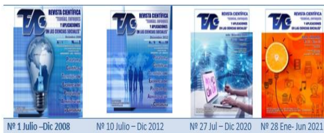
Figura 3. Portadas de la revista TEACS.

Con la intención de aminorar costos de reproducción, el rodaje impreso de la revista se realizaba en escala de azules, convirtiéndose este color en un representante de la imagen la revista inclusive hasta el momento, para ilustrar se muestran tres portadas de la revista, que muestran la escala de azules en las cuales eran impresas, una vez puestas en formato digital, se agregan nuevos colores (Figura 3).