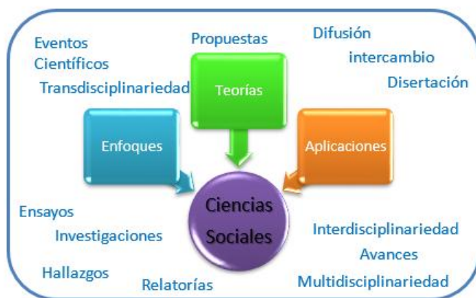
Figura 1. Diagramación realizada para dar nombre a la revista.

En cuanto al nombre que lleva la revista cuyas iniciales son TEACS, se basó en tratar de ampliar las posibles publicaciones e investigaciones, eventos y ensayos que se desarrollaran alrededor de las Ciencias Sociales, en diferentes dimensiones y áreas de aplicaciones de las mismas. La Figura 1 representa la imagen de lo que resultó como final para la colocación del nombre, quedando así aprobado por el Comité Editorial como Teorías, Enfoques y Aplicaciones en las Ciencias Sociales, con sus iniciales TEACS.