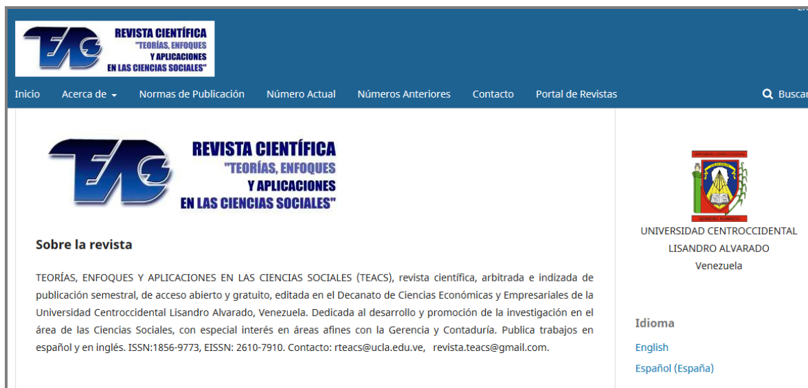
Figura 4. Sitio web actual de TEACS en el Portal institucional de Revistas Científicas UCLA. https://revistas.uclave.org/index.php/teacs

Frecuencia de publicación: Semestral. Correo: rteacs@ucla.edu.ve Sitio web: https://revistas.uclave.org/index.php/teacs Universidad Centroccidental Lisandro Alvarado (UCLA), Venezuela.