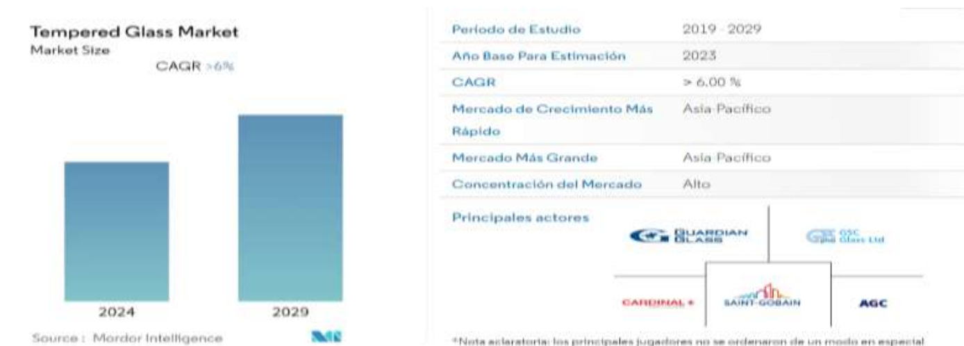
Gráfico 1. Proyección tamaño del mercado de vidrio templado en el mundo.

grandes niveles de productividad del sector industrial y desarrollo en los países como India, China y Japón (ver gráfico 1).